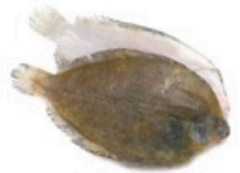
LENGUADO LIMÓN 10 Kg 4,98€/Kg