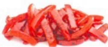
PIMIENTO ROJO ASADO 5 X 1Kg 2,59€/Kg