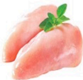
PECHUGA DE POLLO ENTERA 5 Kg 3,98€/Kg