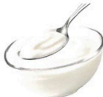
YOGUR GRIEGO 1Kg 3,98€