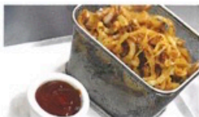
CEBOLLA FRITA 4 X 0,5 Kg 6,98€/Kg