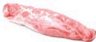
SOLOMILLO DE CERDO 10 Kg 5,80€/Kg