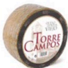
QUESO CURADO 100% OVEJA 10,98€/Kg