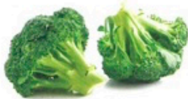
BRÓCOLI EXTRA 4 X 2,5 Kg 1,09€/Kg