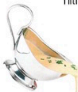
SALSAS: -Pil pil 9,98€/1Kg -Vizcaína 7,98€/1 Kg -Pollo rustido 4,98€/1Kg