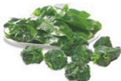
ESPINACAS PORCIONES 4 X 2,5Kg 1,26€/Kg