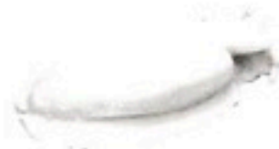
SEPIA INDIA 2/4 6 Kg 7,98€/Kg