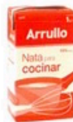
NATA DE COCINA 1 litro 1,59€