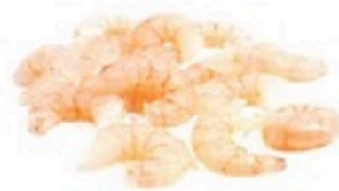
GAMBA PELADA 10/30 6 X 1Kg 6,98€/Kg