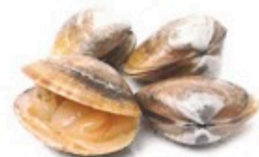
ALMEJA MARRÓN 6 X 1Kg 3,85€/Kg