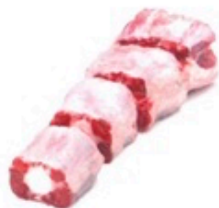
RABO DE TORO CORTADO 8 Kg 7,98€/Kg