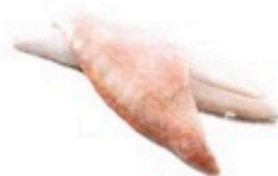
GALLINETA FILETE 6 Kg 4,98€/Kg