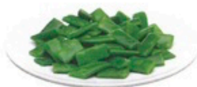
JUDÍA VERDE PLANA 4 X 2,5Kg 1,29€/Kg