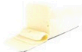
QUESO EDAM BARRA 4,98€/Kg