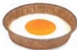
HUEVO FRITO 45 grs 0,50€/ud