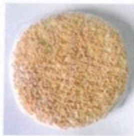
PIZZA POLLO MARGARITA Base de pollo crujiente con tomate frito y mozzarella (sin gluten y sin aceite de palma) 6 ud/caja 2,49€/ud