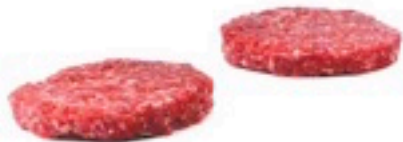
HAMBURGUESA GALLEGA 175 grs 42 uds 1,29€/ud