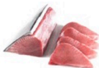
LOMO DE ATÚN ENTERO 6,98€/Kg