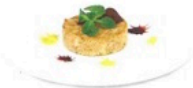
TIMBAL BUTIFARRA CON VERDURAS (150grs) 1,40€/ud