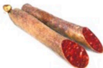
CHORIZO IBÉRICO 8,98€/Kg