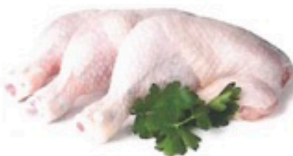
CUARTO TRASERO DE POLLO 5 Kg 1,59€/Kg