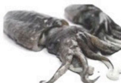
CALAMAR SUCIO 6/10 2 Kg 4,98€/Kg