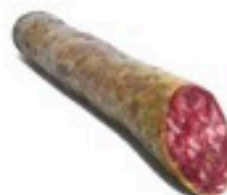
SALCHICHÓN IBÉRICO 8,98€/Kg