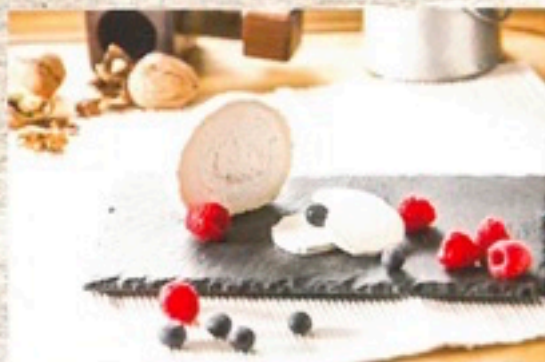
QUESO DE CABRA CORTADO GRANDE 0,64€ ud PEQUEÑO 0,08€