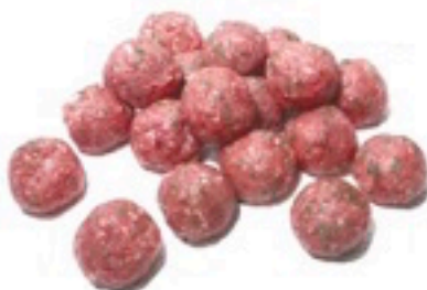
ALBÓNDIGAS DE TERNERA 4 Kg 3,98€/Kg