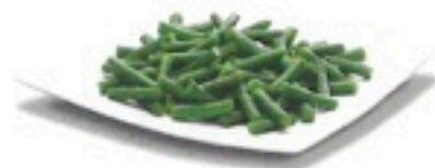
JUDÍA REDONDA TROCEADA 4 X 2,5Kg 1,26€/Kg