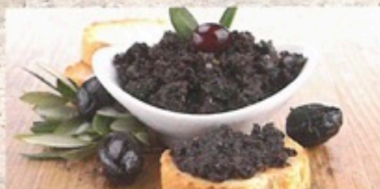
OLIVADA 5,98€/bote 1 Kg