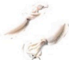
SEPIA INDIA 5/7 6 Kg 6,98€/Kg