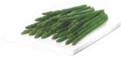
ESPÁRRAGOS VERDES G 1 X 5 Kg 6,70€/Kg