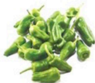
PIMIENTO PADRÓN FRITO 2 X 1,5 Kg 11,45€/Kg