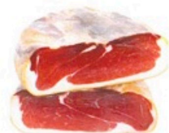
CENTRO JAMÓN BODEGA 7,98€/Kg