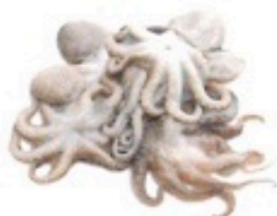
PULPITO 26/40 5 X 1Kg 4,98€/Kg