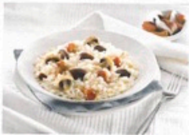
RISOTTO AL FUNGHI 20 X 450 gr 1,35€/ud (2 raciones por ud)