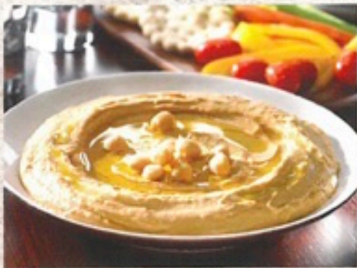
HUMMUS 5,65€/bote 1 Kg