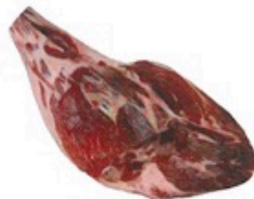
PALETILLA IBÉRICA DESHUESADA 26,98€/Kg