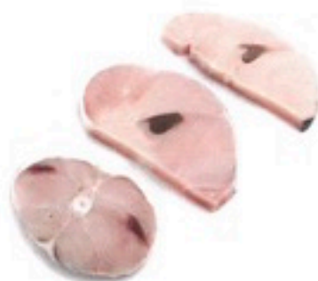
MARRAJO RODAJAS 7 Kg 4,85€/Kg