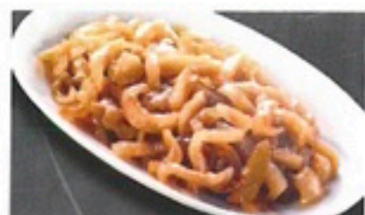
CEBOLLA CAMELIZADA BOTE 500 gr 2,85€/ud