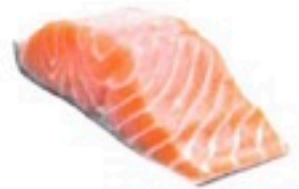
SALMÓN SUPREMAS 5 Kg 5,98€/Kg