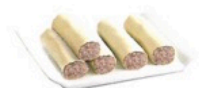
CANELON DE CARNE SIN BECHAMEL 60 ud 0,27€/ud