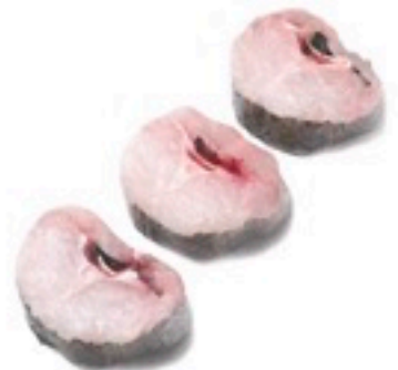
MERLUZA RODAJA 7 Kg 4,85€/Kg