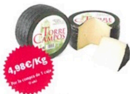
QUESO SEMI MEZCLA 6,98€/Kg