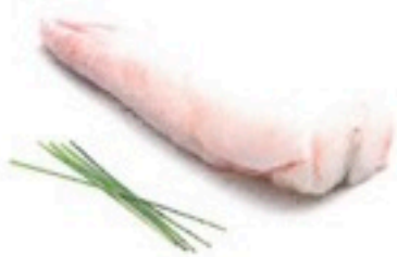
COLA RAPE 150/250 7 Kg 5,45€/Kg