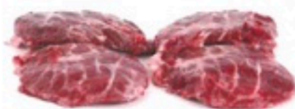
GALTA DE CERDO S/H 10 Kg 5,98€/Kg