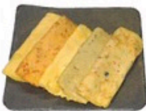
MIX DE TORTILLAS (75 grs) 2,75€/bandeja