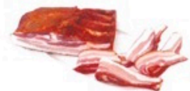
BACON AHUMADO LONCHEADO 4,98€/Kg