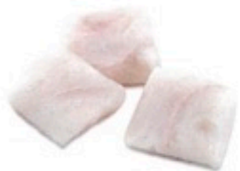
LOMOS DE MERO S/P 5 Kg 5,98€/Kg