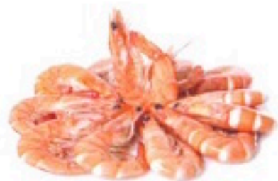
LANGOSTINO COCIDO 60/80 2 Kg 6,98€/Kg