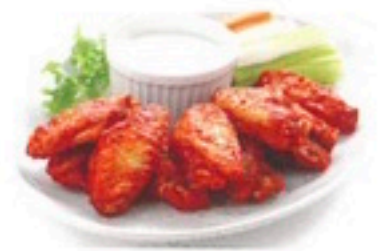
ALITAS PICANTES 3 Kg 5,35€/Kg