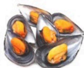
MEJILLON MEDIA CONCHA 2 Kg 4,98€/Kg