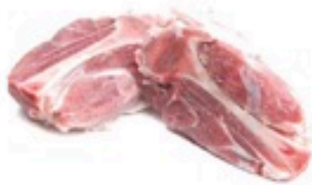
CODILLOS PARTIDOS 5 Kg 2,98€/Kg