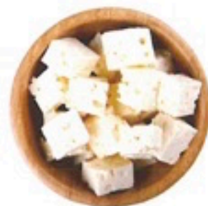
QUESO CUBITOS 4,98€/1 Kg