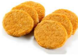
Hamburguesa crunchy 5 Kg 0,55€/ud