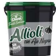
Allioli negro 1 litro 7,45€/litro