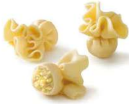
Sacchettini de queso y pera 4x1 Kg 9,35€/Kg