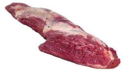
Solomillo de ternera 9,98€/Kg

Por la compra de cualquier caja de carne regalo de 1 salsa de setas *Hasta agotar existencias