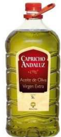
Aceite oliva virgen extra 5 litros 20,55€/ud