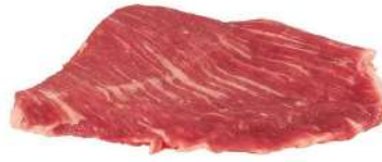
Secreto de cerdo blanco 6 Kg 5,45€/Kg