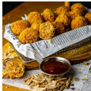
Pulled crocks smoked 3 Kg 0,15€/ud