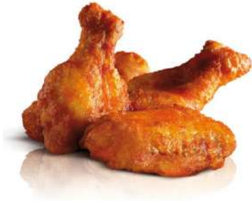
Alitas barbacoa 5 Kg 0,19€/ud