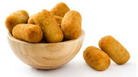
Croquetas de cocido Premium 2 Kg 0,19€/ud