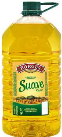
Aceite oliva suave 5 litros 19,45€/ud