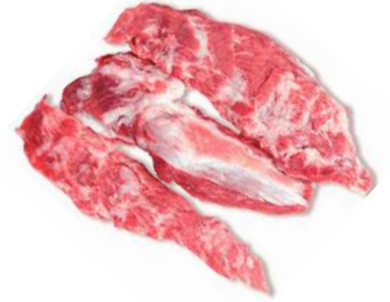
Pluma duroc 6 Kg 7,98€/Kg