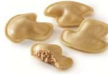
Fungo funghi porcini 4x1 Kg 5,35€/Kg