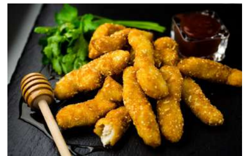
Tenders barbacoa y miel 3 Kg 0,17€/ud