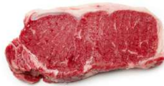
Lomo bajo cortado Black Angus 7 Kg 9,98€/Kg