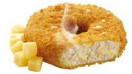
Mini rosquilla de pollo y queso 5 Kg 0,24€/ud