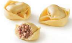
Tortellini de carne 2Kg 7,45€/Kg