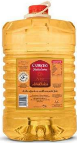
Aceite freir Artesoleico 2x7,5 litros 25,95€/caja