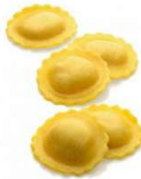
Margarita de alcachofa y jamón 2 Kg 8,75€/Kg