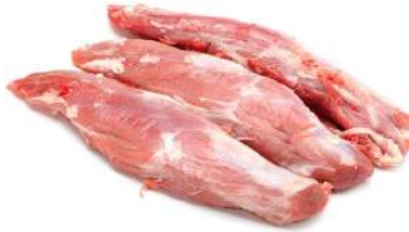
Solomillo de cerdo 10 Kg 5,98€/Kg