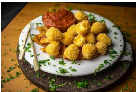
Cheddar bites con jalapeño 4 Kg 0,12€/ud