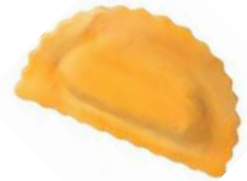
Agnolotti tartufo 2 Kg 6,98€/Kg