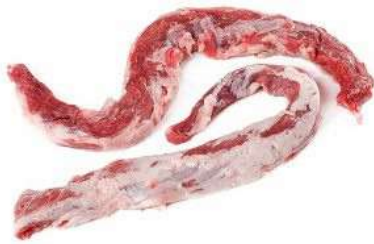
Lagarto duroc 6 Kg 5,75€/Kg