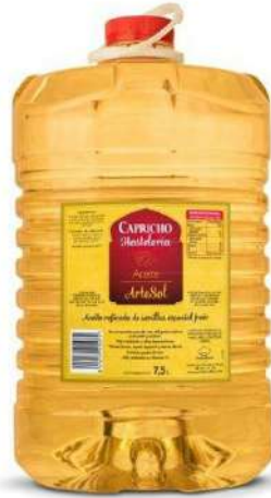
Aceite Artesol freir 2x7,5 litros 22,95€/caja