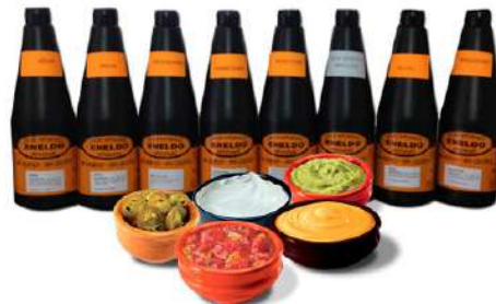
Salsas Eneldo: Brava Miel y mostaza Barbacoa César Bote 1 litro /5,98€