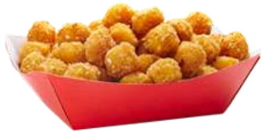
Pops de pollo 5 Kg 0,04€/ud