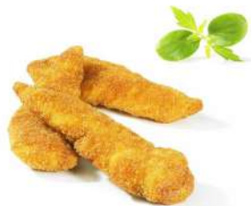
Solomillo crunchy 5 Kg 0,30€/ud