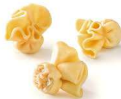
Sacchettini 7 quesos 4x1 Kg 6,55€/Kg