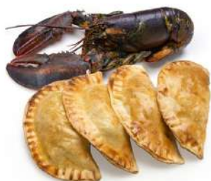
Empanadillas de bogavante 0,68€/ud