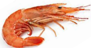
Gamba langostinera Nº 1 9,98€/Kg Nº 2 8,98€/Kg Nº 3 8,98€/Kg