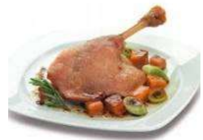
Confit de pato 12ud 29,98€/lata