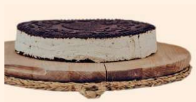
Tarta redonda crema y chocolate 16rac. 12,98€/ud