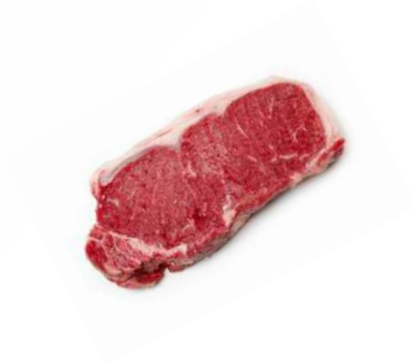
Lomo bajo Black Angus cortado 7Kg 9,98€/Kg