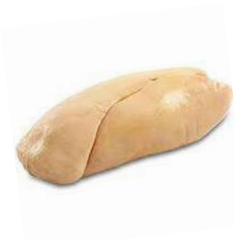
Foie Por piezas 22,98€/Kg