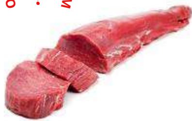
Solomillo de ternera 6,98€/Kg