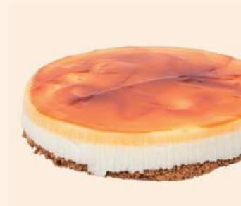
Tarta redonda tocinillo de cielo y queso 16rac. 12,98€/ud