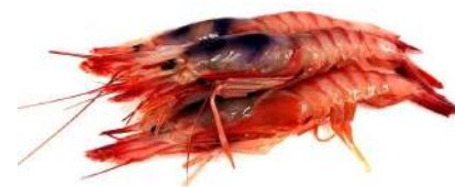
Gamba alistada 10/20 17,98€/Kg