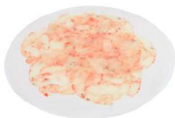
Carpaccio de gamba 3,98€/Kg