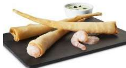
Twister de langostinos 1,5 Kg 19'98€/caja