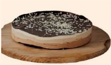
Tarta redonda 3 chocolates 16rac. 12,98€/ud