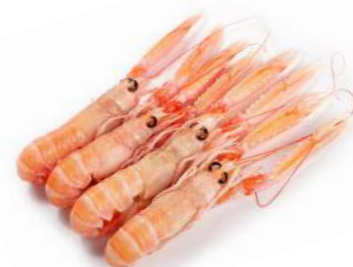
Cigalas Nº 0 (8/12) 13,98€/Kg Nº 1 (13/16) 12,98€/Kg Nº 2 (17/20) 10,98€/Kg Nº 3 (20/30) 7,98€/Kg