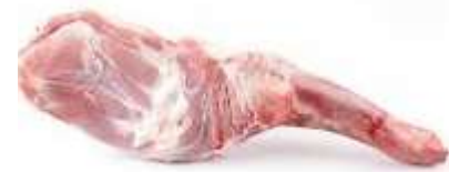
Paletilla de cordero 7,98€/Kg