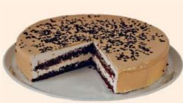
Tarta redonda Nocciolata 16rac. 12,98€/ud