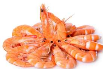
Langostino cocido 60/80 2Kg 7,98€/Kg