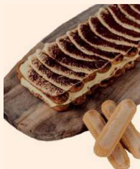
Banda Tiramisú 8-10 rac. 9,98€/ud

Kbó Aliments, s.l. C/Francesc Layret, 12-14 nave 14 Pol. Ind. SANT ERMENGOL-2 08630 ABRERA (BARCELONA)