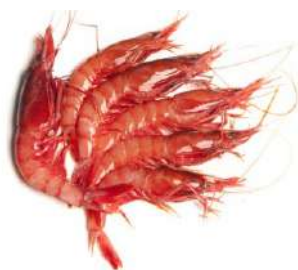
Gamba roja extra 29,98€/Kg