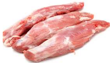
Solomillo de cerdo 6 Kg 5,98€/Kg