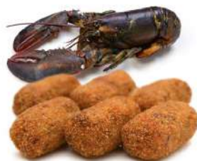
Croqueta de bogavante 0,29€/ud