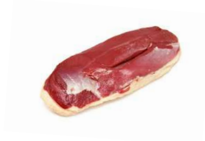
Magret de pato Por piezas 11,98€/Kg